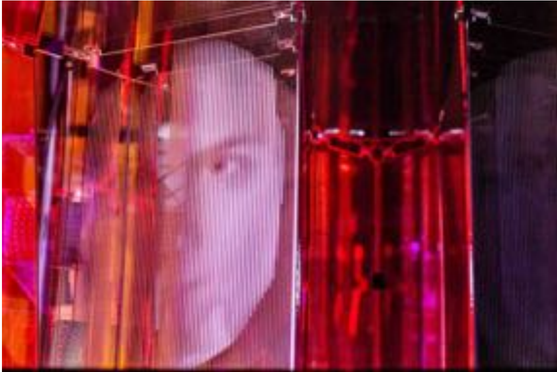
Monday, March 11, 2013 (Sculpture I), Montreal (CA), 2015. Photo : Sébastien Roy