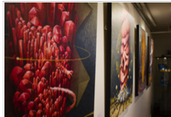
Un arracheur de dents doté de sensibilité