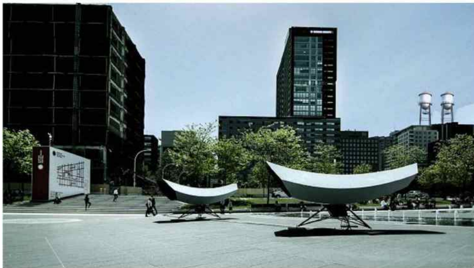
© @Herman Kolgen | L'installation Eotone, d'Herman Kolgen

Par Stéphane Grammont | Publié le 13/10/2014 | 17:05, mis à jour le 14/10/2014 | 09:14